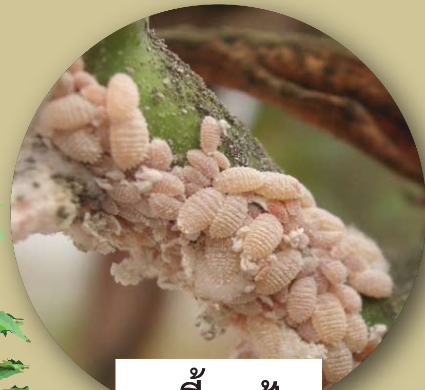
เพลี้ยแป้ง