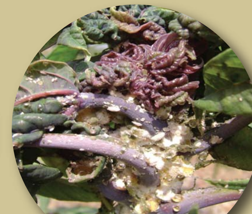
ระบาดรุนแรง