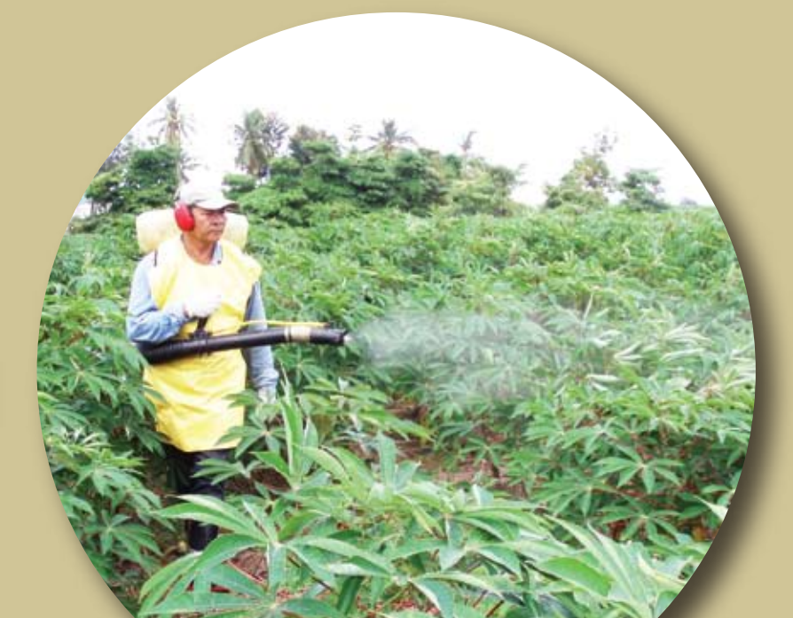
ฉีดพ่นกำจัดเพลี้ยแป้ง

สอบถามข้อมูลเพิ่มเติมได้ที่ : มูลนิธิสถาบันพัฒนามันสำปะหลังแห่งประเทศไทย กรุงเทพฯ โทร. 02-679-9112-6 ห้วยบง โทร. 044-249-770, 081-925-0374