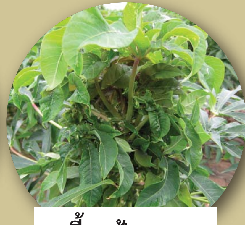
เพลี้ยแป้งระบาด