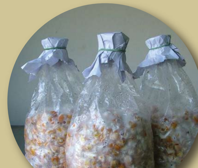
เชื้อราบิวเวอเรีย