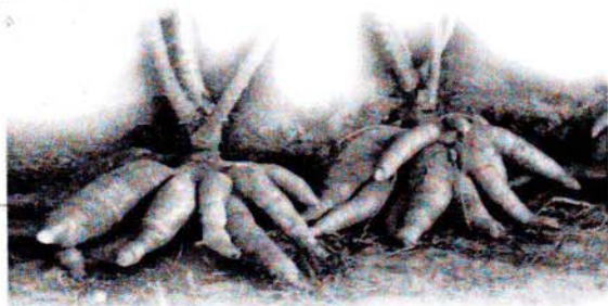
มันสำปะหลัง